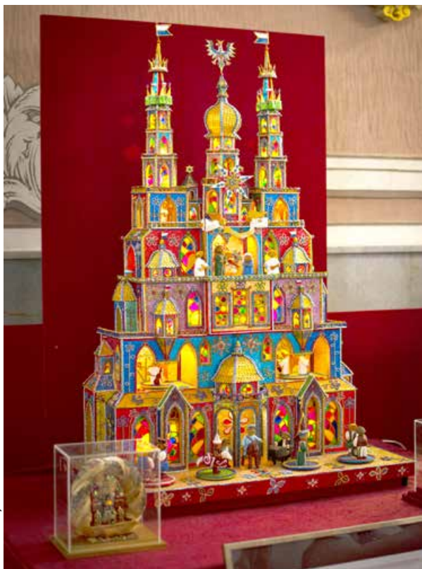
Wystawa szopek krakowskich

W tym samym czasie, a więc ok. godziny 11.00, nasi kolejni goście, tym razem z Artena we Włoszech, przystąpili do wykonywania kwiatowych krucyfiksów przed kolegiatą. Zwyczaj ten po raz pierwszy pojawił się w 1861 r. i do chwili obecnej odbywa się przy okazji procesji ku czci Matki Boskiej Łaskawej z Artena. Krucyfiksy wykonywane są z drewna i zdobione trzcina, dzikimi szparagami i kwiatami. Sztuka ich wykonania przekazywana jest kolejnym pokoleniom.