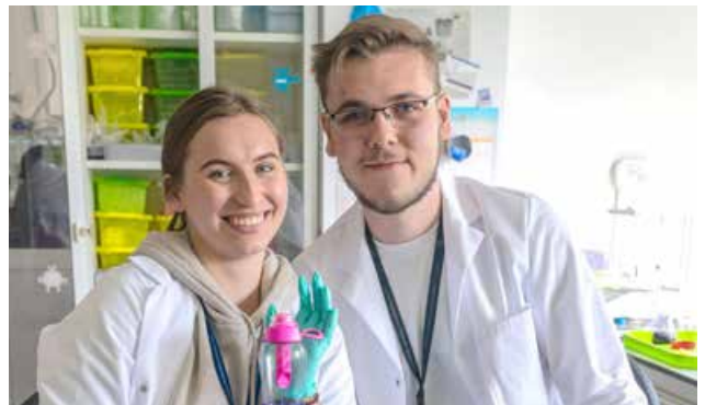
Rezultaty prac. Filtr z uniejowskich alg