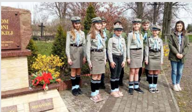
Harcerze na obchodach upamiętniających Ofiary Zbrodni Katyńskiej

Wierzmy, że poprzez podejmowane działania uchronimy Ziemię od dalszej dewastacji.