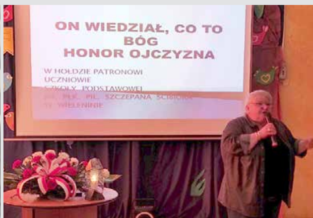
Dzień Patrona Naszej Szkoły