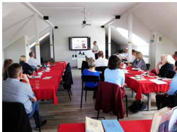
arch. M-GBP w Uniejowie

W kolejnych dniach, tj. 10 i 11 maja br., klubowicze wzięli udział w Międzynarodowej Konferencji „Dziedzictwo kulturowe – szanse i wyzwania dla samorządów”, która odbyła się w Zamku Arcybiskupów Gnieźnieńskich w Uniejowie.