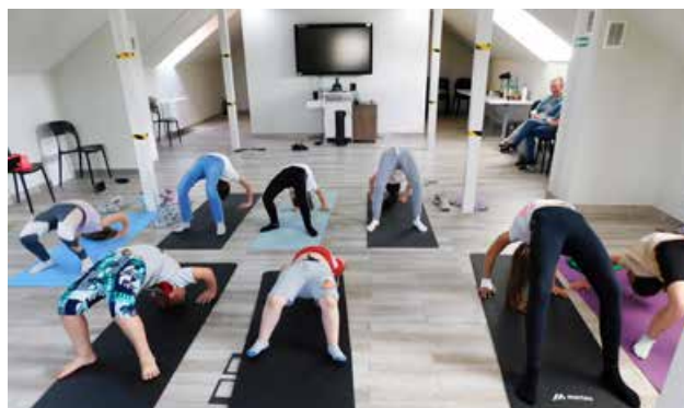
arch. M-GBP w Uniejowie

cyjno-relaksacyjne. Ponadto joga zwiększa poziom skupienia i koncentracji, pomaga w budowaniu poczucia własnej wartości i pozwala zaakceptować swój światopogląd już od najmłodszych lat.