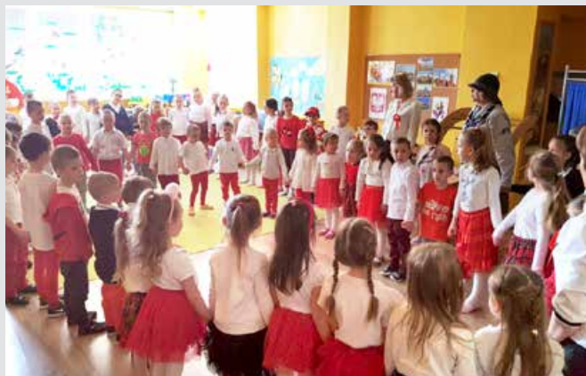
Występ przedszkolaków z okazji majowych świąt patriotycznych