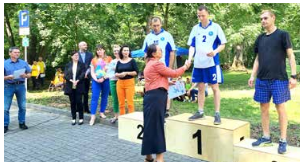
Dyplomy wręczone uczestnikom Spartakiady