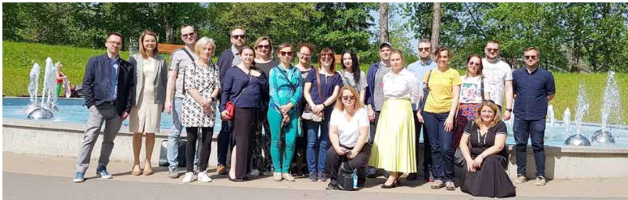
arch. Departament Strategii MF:PR