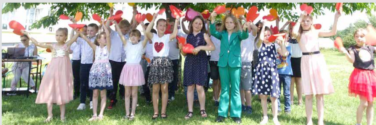
Występ dzieci z okazji Dnia Rodzinki

Natomiast w piątek na zakończenie Tygodnia Zdrowia odbył się przemarsz ulicami Wilamowa. Każda klasa oraz oddziały przedszkolne przygotowali kolorowe transparenty z hasłami promującymi zdrowie. Nie zabrakło różnobarwnych pomponów, a także instrumentów, z którymi maszerowały dzieci. Po wyjściu ze szkoły uczniowie razem z wychowawcami ustawili się rzędami, tworząc długi, kolorowy korowód. Wyruszyliśmy z uśmiechniętymi buziami i dużym zapałem na ulice, aby