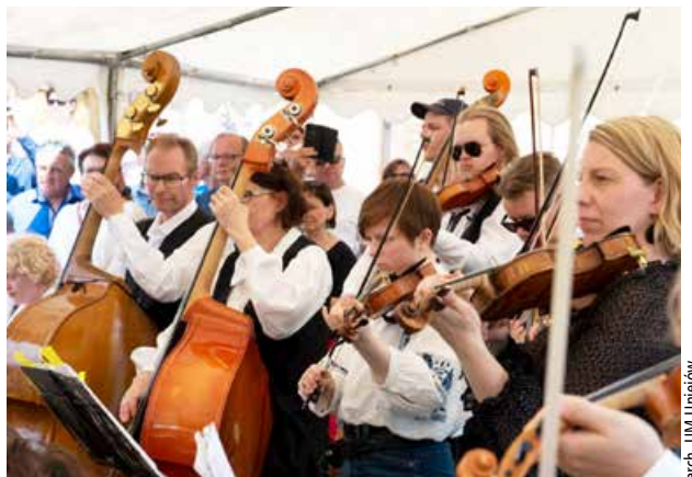
Skrzypkowie z Kaustinen w Finlandii

Podczas gdy na trasie procesji zaczęły pojawiać się pierwsze motywy, w Kościele pw. Podwyższenia Krzyża Świętego w Spycimierzu otwarta została wystawa