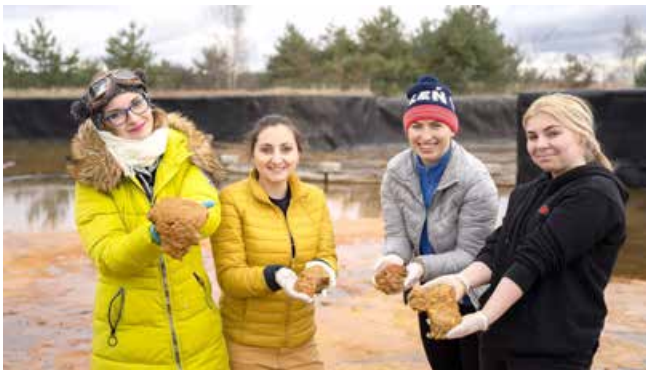
Pobieranie uniejowskich alg do badań

Czekamy zatem na ciąg dalszy i życzymy powodzenia. Szczegółowe informacje o wynikach badań znajdują Państwo na stronie Geotermii Uniejów: www.geotermia-uniejow.pl