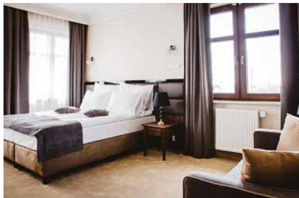
Wnętrze pokoju hotelowego

Z kolei na stronach internetowych www.palac-uniejow.pl oraz www.uniejow.net.pl dowiadujemy się, że Pałac Uniejów, położony na skarpie z przepięknym ogrodem oraz dostępem do rzeki i nad-