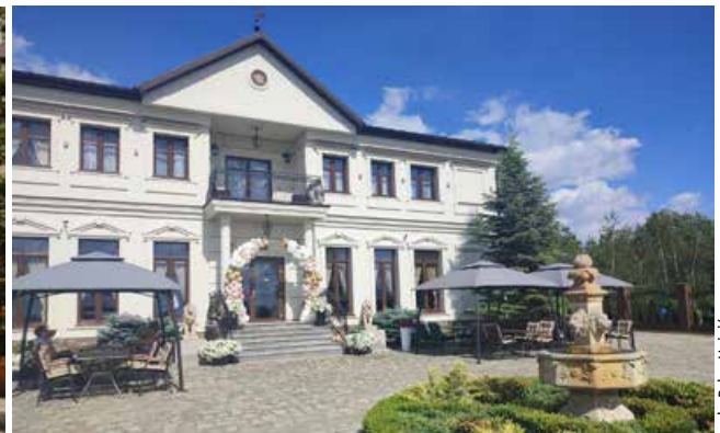
Zewnątrz strefa SPA