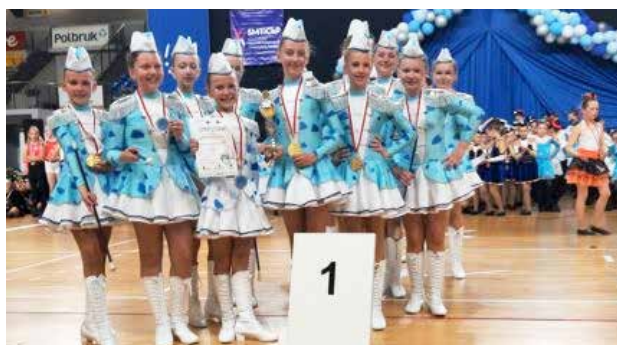
arch. Mażoretki Driady Uniejów

Organizatorami wydarzenia byli: Stowarzyszenie Mażoretok Tamburmajerek i Cheerleaderok Polskich, Gmina Kędzierzyn-Koźle i Urząd Marszałkowski Województwa Opolskiego.