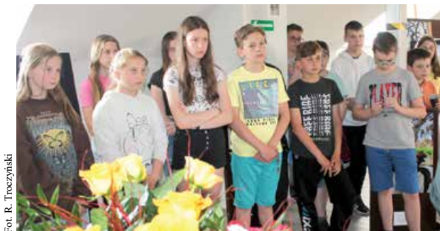
Młodzież na otwarciu wystawy

Wystawa była dostępna dla wszystkich zainteresowanych osób do dnia 30 czerwca 2022 r. Obejmowała prace związane z przyrodą, naturą, zwierzętami, a także z infrastrukturą gminy Uniejów.