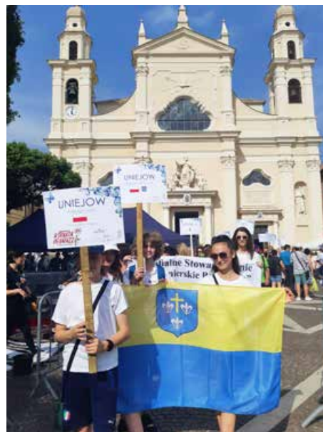
arch. Parafiałne Stowarzyszenie „Spycimierskie Boże Ciało”

Rewizyta gości z Włoch miała miejsce podczas Święta Bożego Ciała w Spycimierzu. Delegaci ułożyli obraz w formie pionowej struktury naramiennej – tzw. ukwiecony krucyfik, który uświetnił uroczystą procesję.