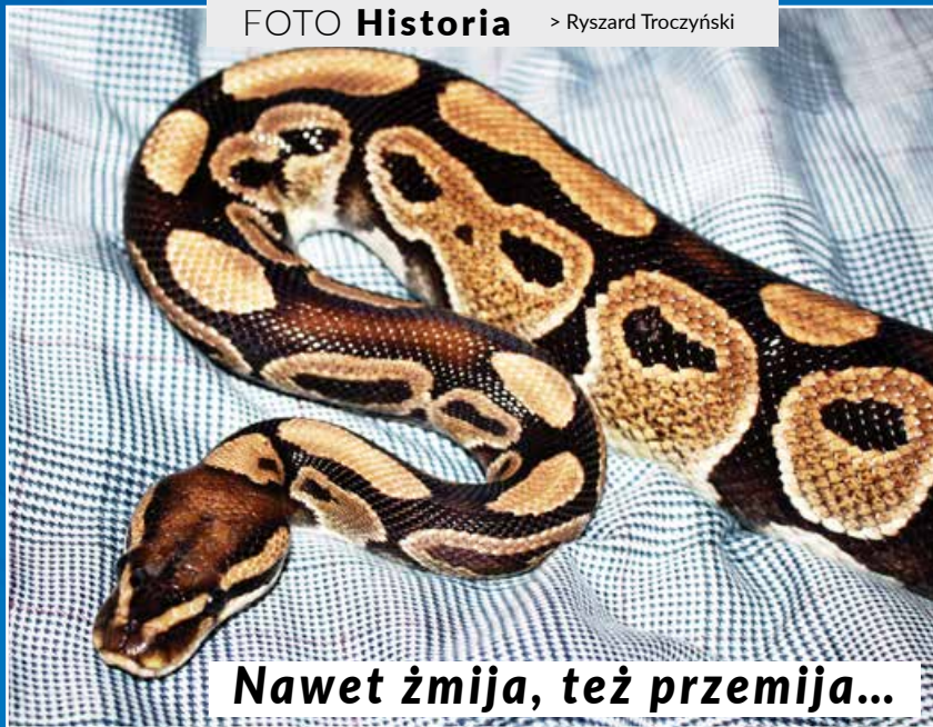
Nawet żmija, też przemija...