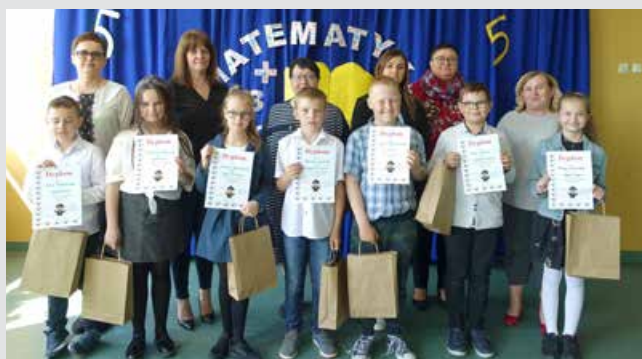
Laureaci Gminnego Konkursu Matematycznego Klas III

11 maja 2022 r. pięćdziesięcioro uczniów klas IV-VIII wyruszyło na trzydniową wycieczkę do Wrocławia i Kotliny Kłodzkiej. Pierwszym punktem programu było zwiedzanie Muzeum Przyrodniczego Uniwersytetu Wrocławskiego. Szczególne wrażenie na uczniach wywarły wielkie szkielety pługwa błękitnego i jelenia olbrzymiego. Ponadto dzieci miały okazję obejrzeć liczne eksponaty ssaków i ptaków – począwszy od wielkich strusi, a skończywszy na najmniejszych przedstawicielach tej grupy, czyli kolibrach. Ogromne zainteresowanie wzbudziła także bogata kolekcja owadów. Następnie uczniowie udali się na spacer po wrocławskiej Starówce, poznając jednocześnie historię miasta opowiadaną przez przewodnika. Później udali się do Świdnicy, gdzie znajduje się Kościół Pokoju. Ta wybudowana w XVII wieku ewangelicka świątynia jest największym drewnianym barokowym kościołem w Europie, a w 2001 roku obiekt został wpisany na listę światowego dziedzictwa UNESCO. Uczniowie