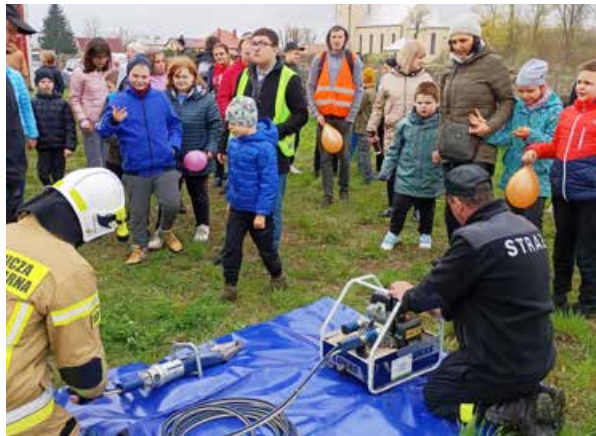
arch. E. Kolasa

naszą młodzież w przekonaniu, jak ważne i potrzebne są wszelkie umiejętności ratujące ludzkie życie oraz wiedza na temat udzielenia właściwej pomocy w różnych sytuacjach. Przykład strażaków i przygotowane zajęcia warsztatowe