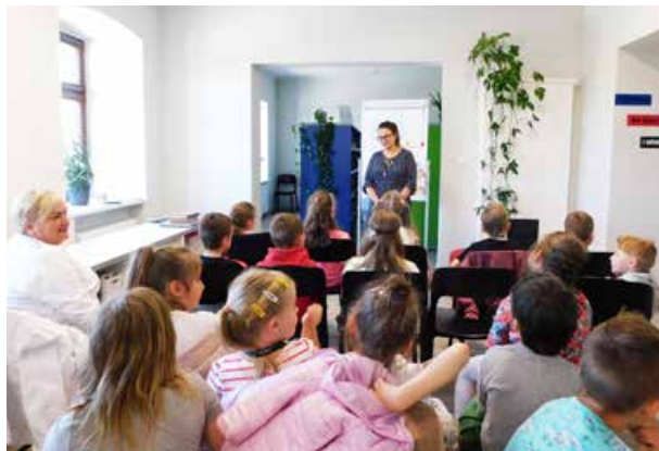
arch. M-GBP w Uniejowie

tywny udział we wszystkich zajęciach i z chęcią odpowiadały na wszystkie pytania. Zdobyta wiedza będzie z pewnością bardzo przydatna w dalszej ich nauce.