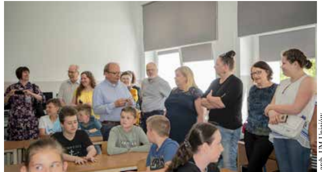
Goście z wizytą w szkole w Wieleninie

Elementem kończącym spotkanie był upieczony specjalnie na tę okazję tort.