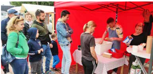
arch. UM Uniejów

Wprawdzie aura pogodowa była bardziej polska niż meksykańska, ale jak wiadomo klimat tworzą ludzie, a ci jak zawsze nie zawiedli. Dobre nastroje dopisywały i goście rozgrzani meksykańską muzyką dali się porwać rytmom meksykańskiej fiesty... jak na „Niedzielę w meksykańskich rytmach” przystało.