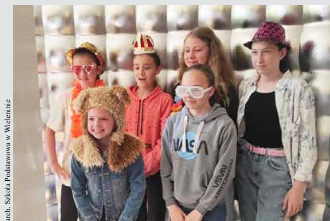
arch. Szkoła Podstawowa w Wieloninie