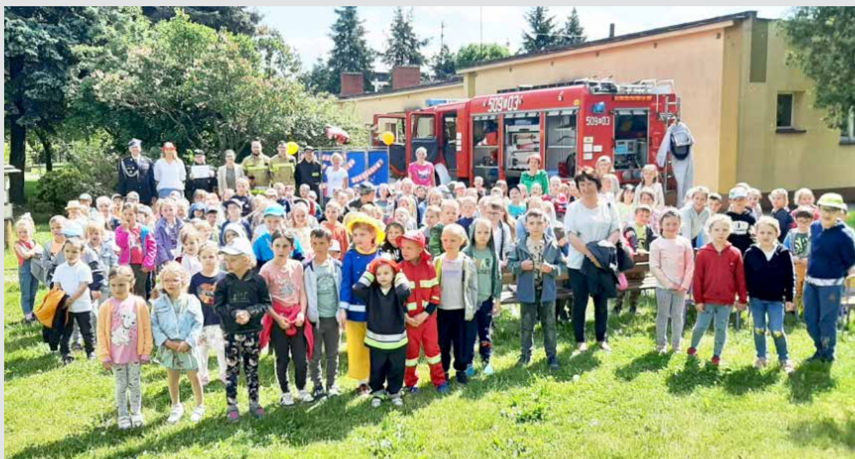
Spotkanie ze strażakami w Dniu Dziecka