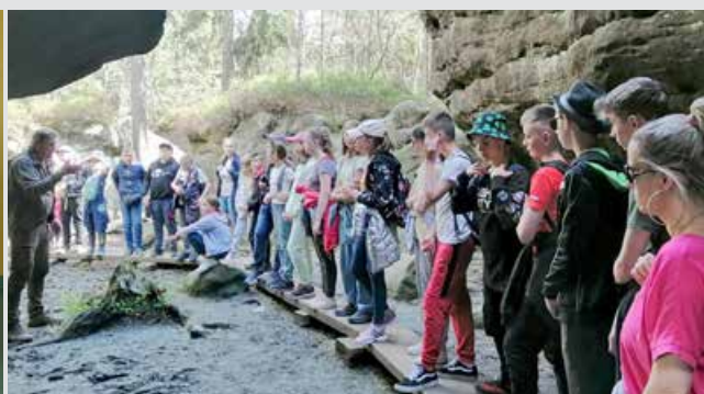
Spacer wśród Błędných Skal