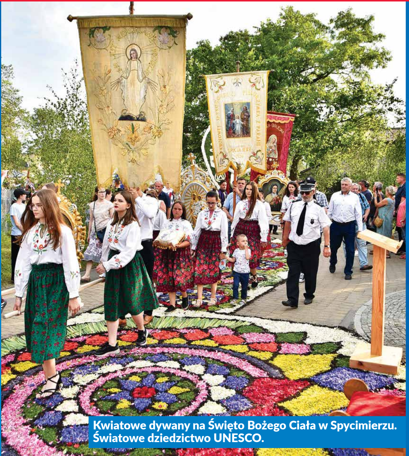
Kwiatowe dywany na Święto Bożego Ciała w Spycimierzu. Światowe dziedzictwo UNESCO.