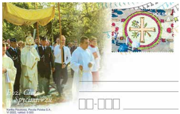
Pocztówka przedstawiająca Boże Ciało w Spycimierzu

Istotnym momentem, kończącym uroczystości Bożego Ciała w Spycimierzu, było wręczenie biskupowi Krzysztofowi Wętkowskiemu symbolicznej kartki pocztowej. Przekazania pocztówki dokonał Prezes Poczty Polskiej. Widokówka wydana została z okazji 700-lecia obchodów Bożego Ciała w Polsce. Wydarzenie to miało wprowadzić miejsce już dwa lata temu, ale z uwagi na panujące wówczas okoliczności związane z pandemią, pocztówka mogła trafić w ręce odbiorcy dopiero podczas uroczystości. Na kartce okolicznościowej widnieją uczestnicy procesji Bożego Ciała w Spycimierzu. W centrum zobaczyć można księdza niosącego monstrancję. W prawym górnym rogu strony adresowej kartki nadrukowano znak opłaty pocztowej, na którym przedstawiono jeden z motywów kwiatowych wykonanych podczas uroczystości w minionych latach.