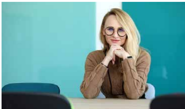
arch. M. Krohn