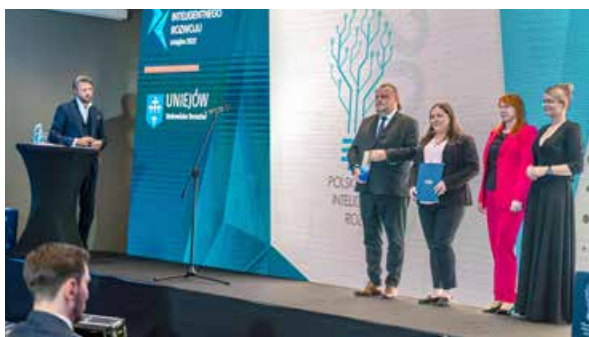
arch. UM Uniejów

tym samym rozwój energetyki niekonwencjonalnej, jako nieodłącznego elementu strategii rozwoju lokalnego. Z prezentacji można było dowiedzieć się, z jakich źródeł czystej energii elektrycznej oraz ciepłej zasilane są podmioty działające na terenie gminy i jakie korzyści dla przedsiębiorców, inwestorów i samych mieszkańców wynikają z zastosowania tych rozwiązań. Uczestnicy panelu poznali także dalsze istniejące możliwości dywersyfikacji źródeł energii, które mogą zostać wdrożone przez władze samorządowe w niedalekiej przyszłości.