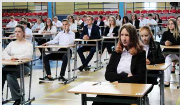
Uczniowie na egzaminie ósmoklasisty

Gratulacje dla mojej uczennicy Julki i wszystkich uczestników konkursu.