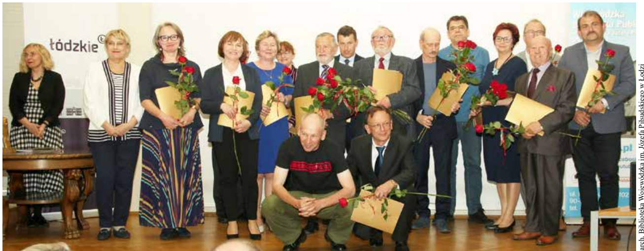
Laureaci Złoty Ekslibrisów

arch. Biblioteka Wojewódzka im. Józefa Piłsudskiego w Łodzi