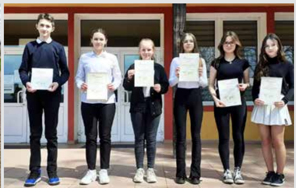
Zwycięzcy VIII Gminnego Konkursu Przyrodniczo-Ekologicznego