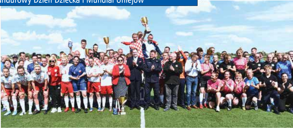
Turniej Pajor&Tarczyńska CUP 2022 w Uniejowie