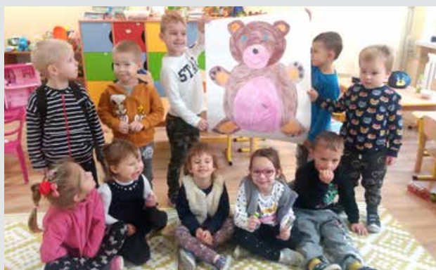
Dzieci w Dniu Pluszowego Misia

Powiatowa Biblioteka Publiczna w Poddębicach zorganizowała Powiatowy Konkurs Plastyczny „Miś – mój ulubiony bohater literacki” dla przedszkolaków w wieku 5-6 lat z powiatu poddębickiego. Zadaniem uczestników konkursu było wykonanie pracy plastycznej przedstawiającej postać ulubionego misia. Do konkursu zostało zgłoszonych 129 prac plastycznych. Wszystkie prace, które zostały nagrodzone, zostały wyeksponowane w Czytelni Ogólnej Biblioteki.