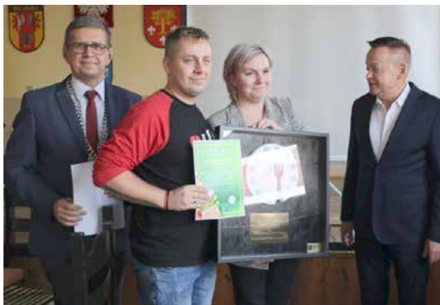
Nagroda dla restauracji „VARTO” w Hotelu Termalnym