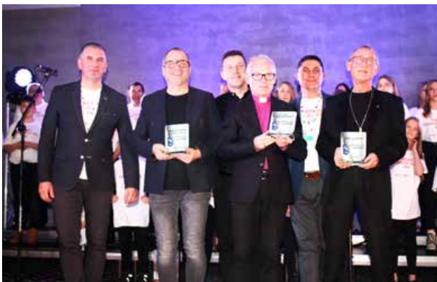
arch. R. Troczyński

Koncert poruszył całą publiczność, która wspólnie z wykonawcami śpiewała i poruszała się w rytm granych utworów.