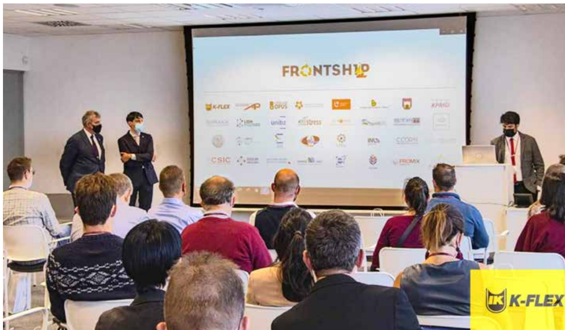
arch. Firma K-Flex