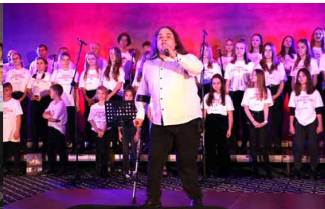
arch. UM Uniejów