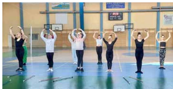
arch. Mażoretki Driady Uniejów

Projekt został dofinansowany ze środków Narodowego Instytutu Wolności – Centrum Rozwoju Społeczeństwa Obywatelskiego w ramach Funduszu Inicjatyw Obywatelskich NOWEFIO na lata 2021-2030.