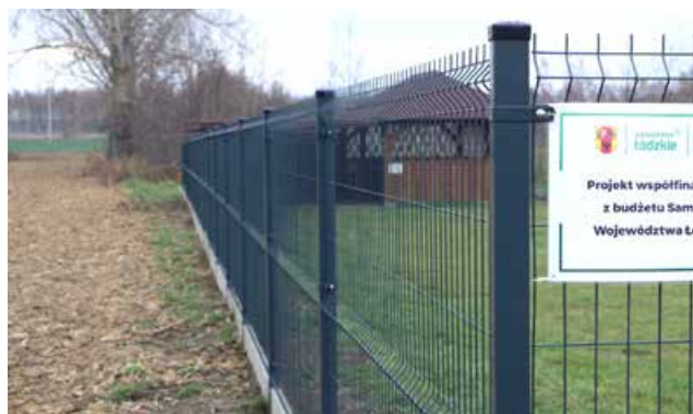
Ogrodzenie terenu w Czekaju