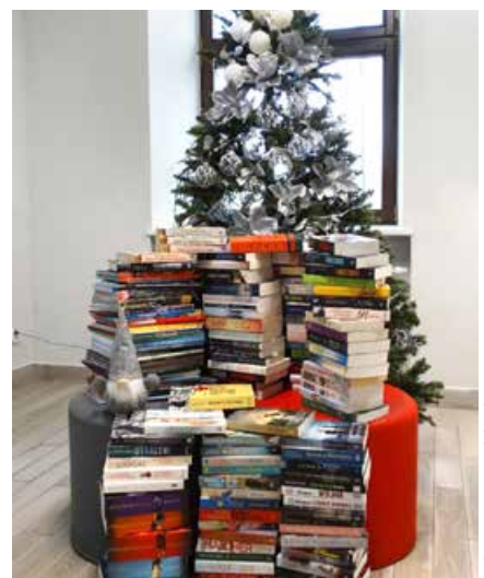
arch. M-GBP w Uniejowie