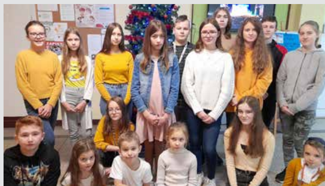
Uczniowie nagrodzeni w konkursach przedmiotowych