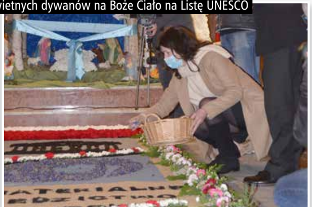
Spycimierskie Boże Ciało 2020