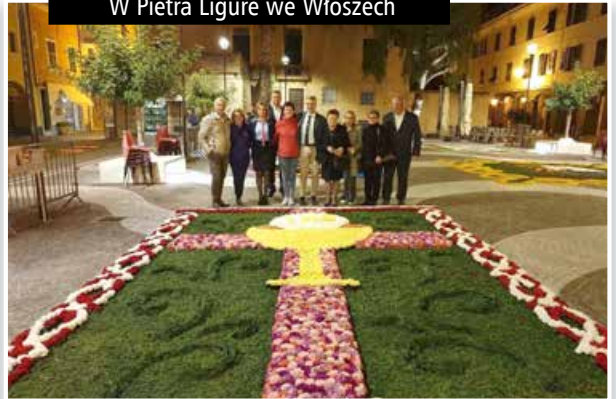
W Pietra Ligure we Włoszech