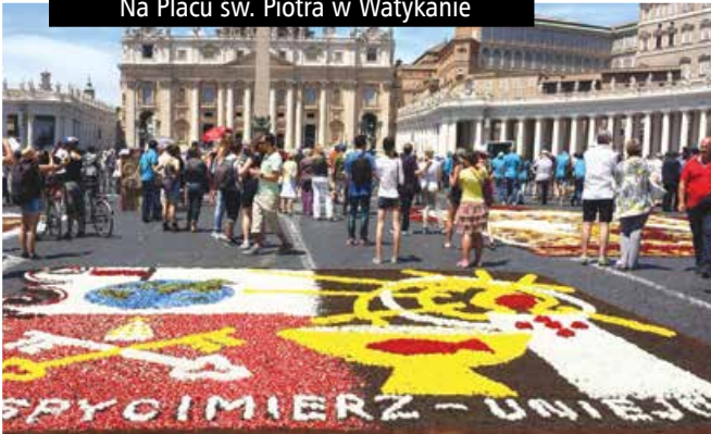
Na Placu św. Piotra w Watykanie