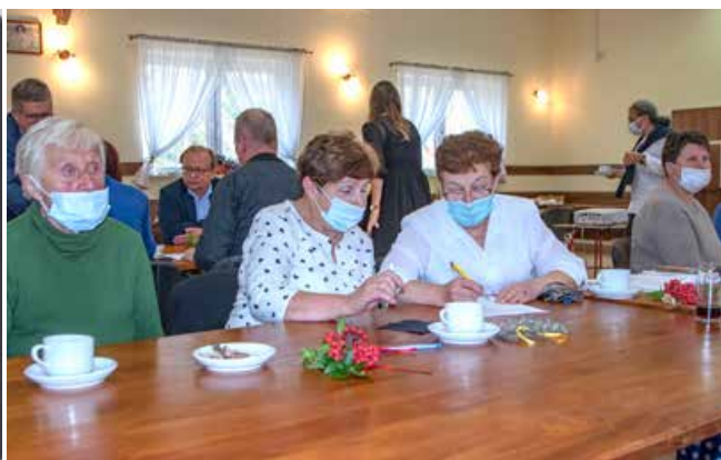
Warsztaty dla depozytariuszy