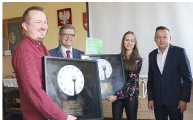
Nagroda dla „Mikser Street Food Uniejów” i Lodziarni „Ochloda”

Gościom Festiwalu, tzw. Degustatorom, w tej samej kategorii, najbardziej przypadł do gustu pomysł restauracji „AQUA” w ApartHotelu „Termy Uniejów”. „Asiety z cukinii z polędwiczką wieprzową” zdobyło najwięcej punktów z paszportach. Niesamowity smak, ale niewątpliwie także sposób podania potrawy, zdecydowały o tym, że właśnie ona znalazła się na pierwszej lokacie.