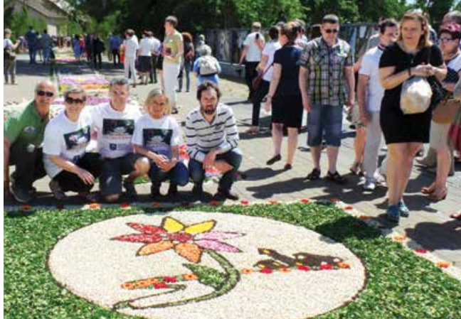
Dywan ułożony przez włoskie stowarzyszenie na uroczystość Boże Ciało w Spycimierzu w 2015 r.