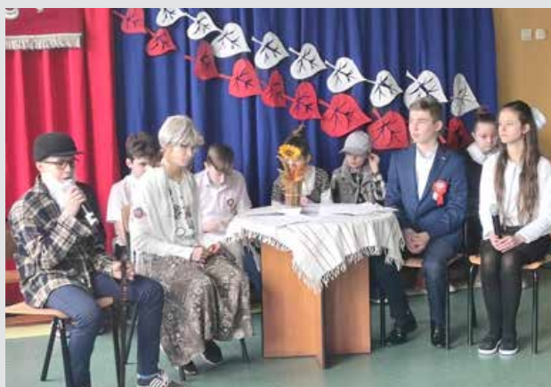
Uczniowie podczas apelu z okazji Święta Niepodległości