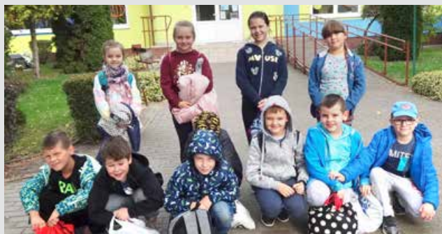
Klasa II przed wyjazdem na baseny w ramach programu „Umiem pływać”

Wigilia św. Andrzeja to czas, aby poznać tradycje andrzejkowe. Pierwszaki nie tylko się z nimi zapoznali, ale przede wszystkim