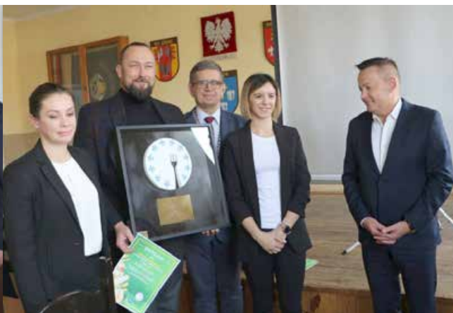
Nagroda dla restauracji „AQUA” w ApartHotelu „Termy Uniejów”