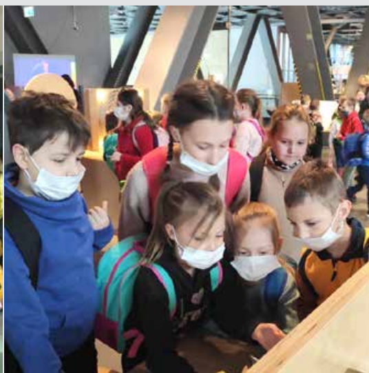
Uczniowie w Międzynarodowym Dniu Osób z Niepełnosprawnością