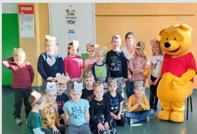
Przedskolaki w Dniu Pluszowego Misia