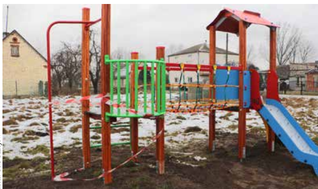
Plac zabaw w Brzezinach

W Czekaju środki z dotacji przeznaczono na stworzenie bezpiecznego miejsca rekreacji, poprzez – planowane już od dawna – ogrodzenie terenu, na którym znajduje się sołecka altana. To miejsce spotkań mieszkańców, które integruje lokalną społeczność i jednoczy ją w celu realizacji kolejnych zadań. Zakup i montaż ogrodzenia z siatki panelowej, wraz z bramą wjazdową i furtką ma na celu ochronę altany i znajdujących się na jej terenie mebli przed ewentualnymi aktami wandalizmu, a także podniesie poziom bezpieczeństwa w czasie organizowanych tam spotkań czy imprez. Koszt inwestycji to kwota 15 000 zł, w 2/3 pokryta