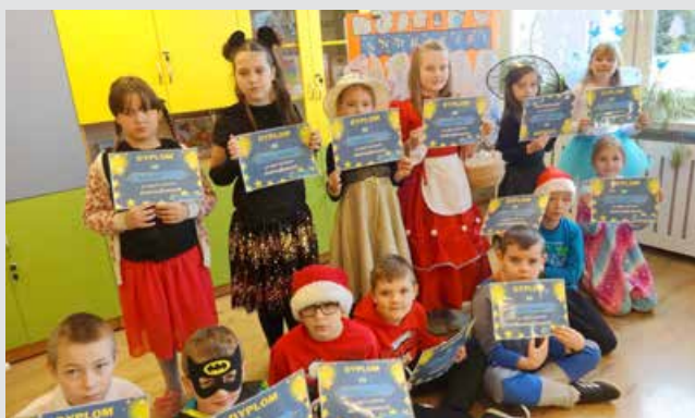
Andrzejki w klasie II