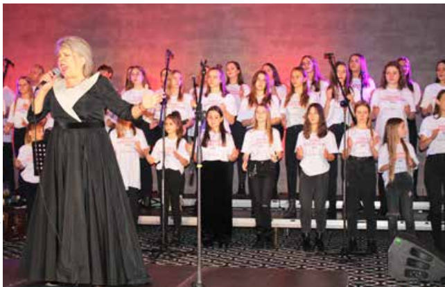
arch. R. Troczyński