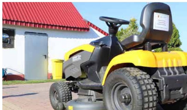
Traktorek kosiarka dla sołectwa Wielenin

z budżetu Województwa Łódzkiego i wsparta z gminnej kasy dofinansowaniem w wysokości 5 000 zł.