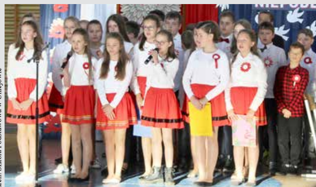
Apel okazji Dnia Niepodległości

Zuchy z 3GZ Krasnonutki uczestniczyły w dniach 26-27 listopada 2021 r. w biwaku, który rozpoczął się od kominka