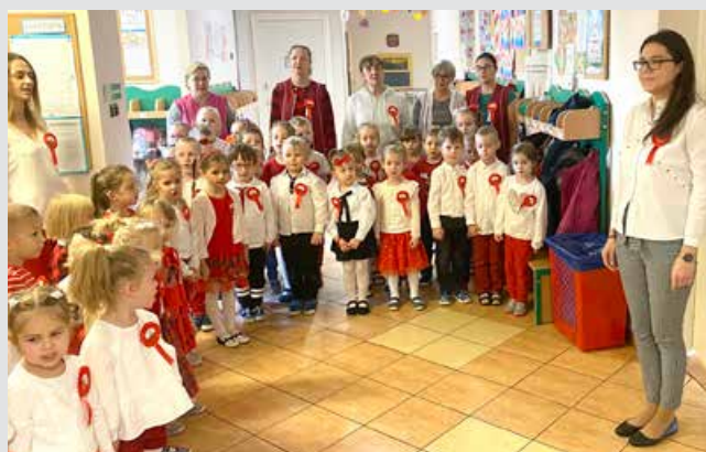
Wspólne śpiewanie hymnu narodowego z okazji 11 listopada

Wszystkim dzieciom i ich rodzicom serdecznie dziękujemy za zaangażowanie oraz udział w akcji.