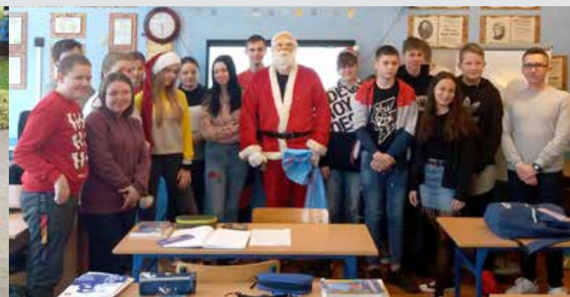
Mikołajki w klasie VIII