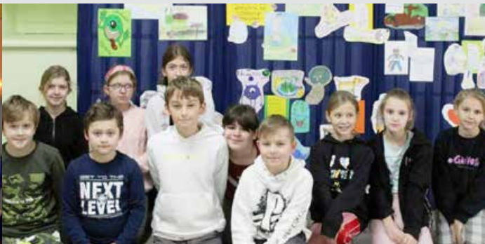
Uczniowie w Międzynarodowym Dniu Łamańców Językowych