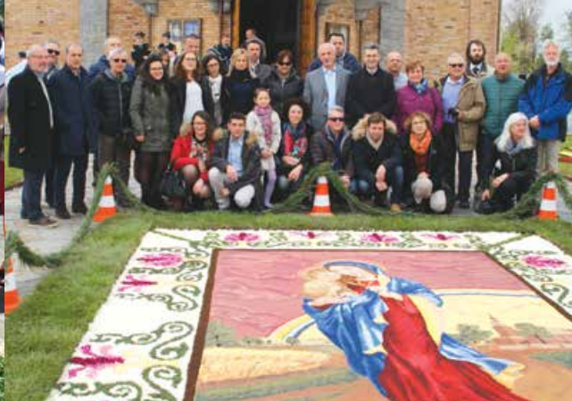
„Tulipany dla Jana Pawła II” – jedno z cyklu wydarzeń zorganizowane w maju 2016 r. przed kościołem Podwyższenia Krzyża św. w Spycimierzu z udziałem włoskiego stowarzyszenia