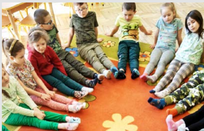
Dzień Kolorowej Skarpetki w oddziale VIII

8 kwietnia 2022 r. dzieci 5- i 6-letnie z Miejskiego Przedszkola w Uniejowie uczestniczyły w spektaklu teatralnym online pt. „Koziołek Matolek”, wystawianym przez Teatr Lalki i Aktora w Łomży. Historia jest adaptacją komiksu autorstwa K. Makuszyńskiego i M. Walentynowicza. Tytułowy Koziołek zawsze budzi wokół siebie radość, a zarazem uczy, że wytrwałość oraz chęć zdobywania wiedzy pomagają w osiągnięciu celu.