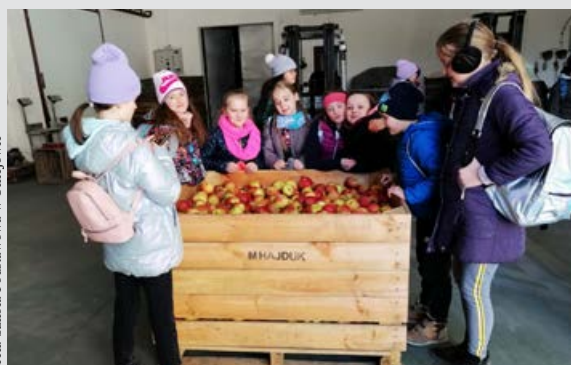
Wycieczka do sadu

Dziękujemy dyrekcji, nauczycielom oraz uczniom ZSR CKP w Kaczkach Średnich za zorganizowanie wieczoru oraz zaproszenie.