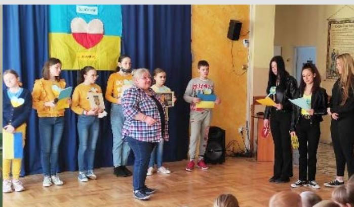
Dzień Solidarności z Ukrainą