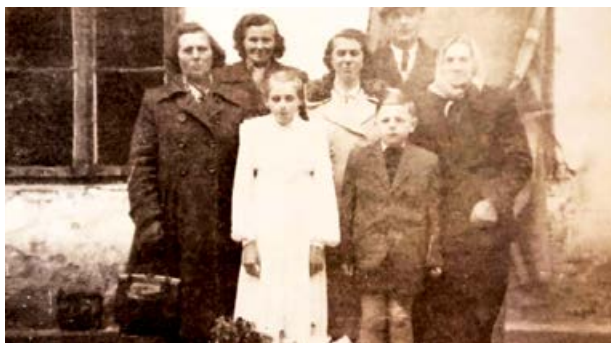
Zdjęcie rodziny z ok. 1955 w Leśniku