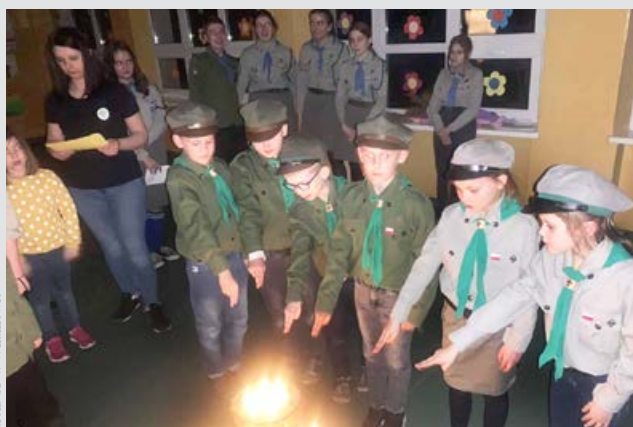
arch. SP w Wilanowie Składanie obietnicy zachowawczej

1 kwietnia to czas żartów, psikusów i przede wszystkim dobrego humoru. Z tej okazji Samorząd Uczniowski ogłosił „Dzień bez plecaka”, a nasi wspaniali uczniowie zorganizowali go sami, przyłączając się do zabawy. Nie sposób wymienić, ile to ciekawych sposobów na przyniesienie swych rzeczy wynaleziono w tym dniu: wózki, skrzynki, koszyki, półeczki, wiatrak, taczka, lodówki i wiele, wiele innych.