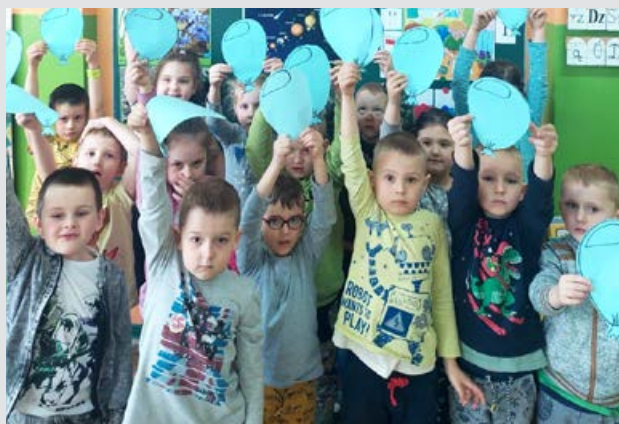
Światowy Dzień Świadomości Autyzmu