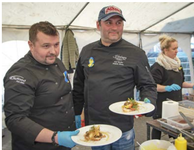
arch. UM Uniejów