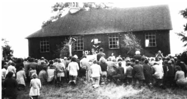
Jeszcze sprzed pożaru drewniany Kościół pw. Wniebowzięcia Najświętszej Marii Panny w Borzewisku – wspomniane w opowiadaniu miejsce odpustów