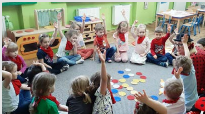
Czterolatki w Krainie Cyfr