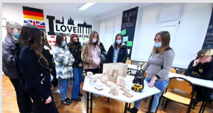
„Wieczór nauki” w Kaczkach Średnich