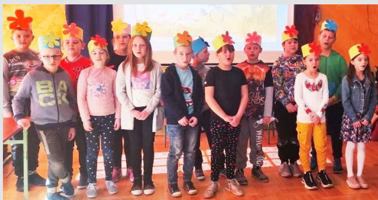
Pierwszy Dzień Wiosny

8 marca 2022 r. jest wyjątkowym dniem w szkolnym kalendarzu. Wtedy swoje święto obchodzą wszystkie kobiety, zarówno te duże, jak i te małe. Od samego rana wszystkie dziewczynki i panie otrzymywały życzenia, kwiaty oraz słodkości.