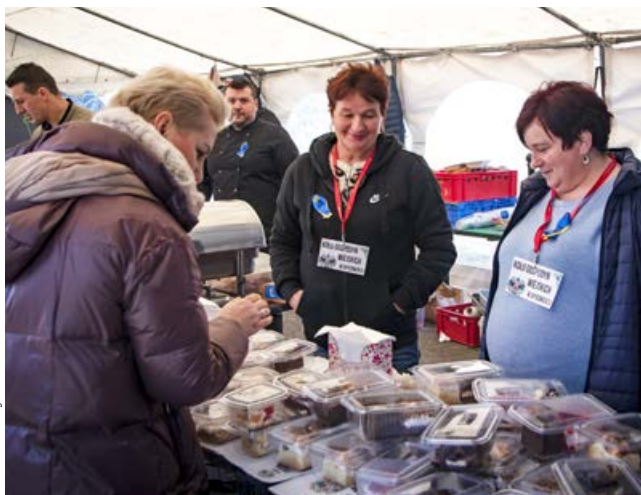
arch. UM Uniejów