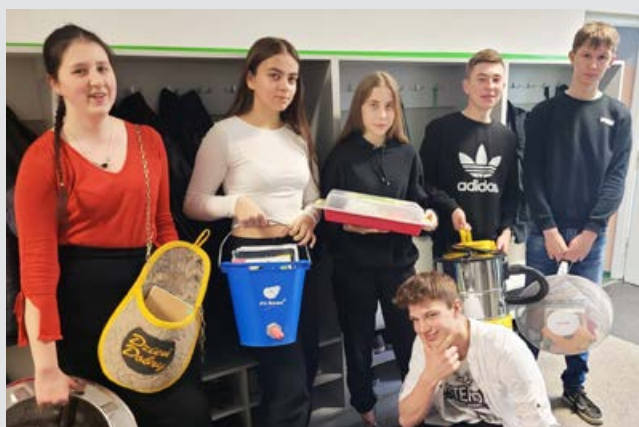
arch. SP w Wilanowie Klasa VIII i ich oryginalne „plecaki”