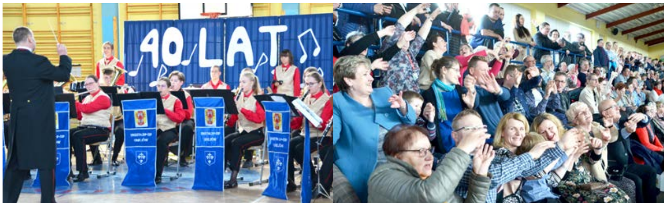
arch. UM Uniejów