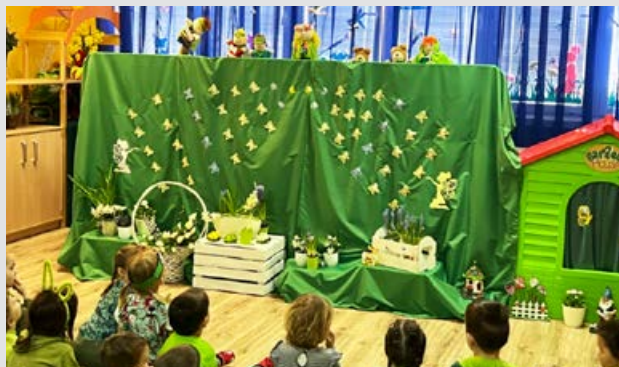
Teatrzyk na Powitanie Wiosny