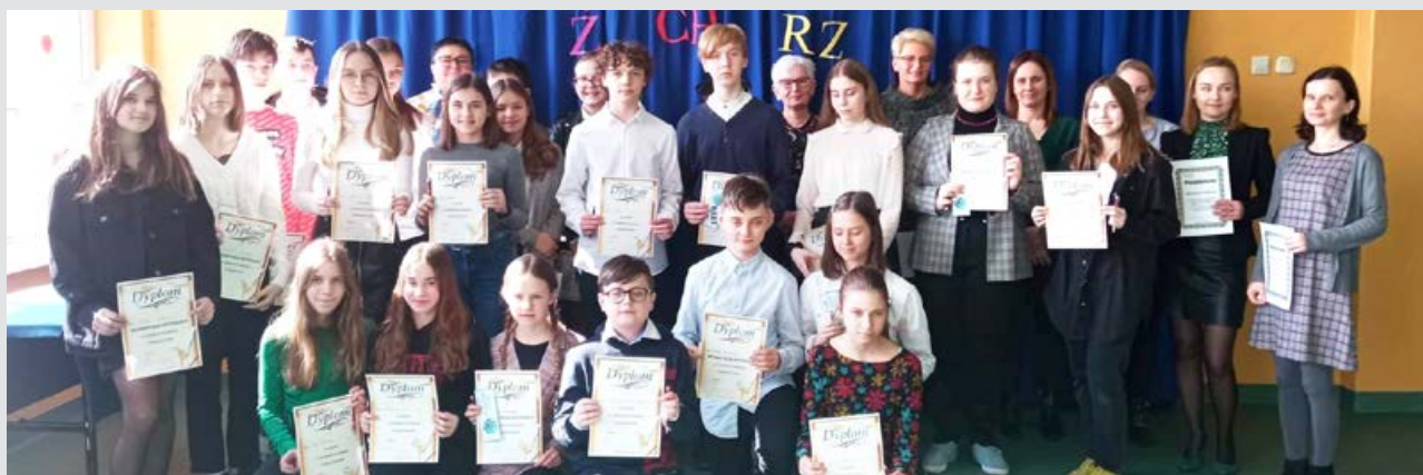
Uczestnicy Gminnego Konkursu Ortograficznego

Mimo niesprzyjającej pogody, biwak uważamy za bardzo udany i z niecierpliwością czekamy na następne.