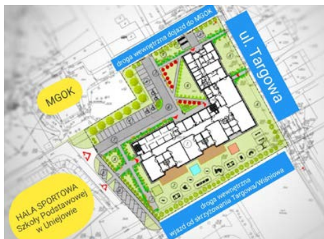
Projekt przedszkola integracyjnego

Inwestycja uwzględnia także zagospodarowanie terenu wokół budynku. Powstaną: nowe drogi wewnętrzne i chodniki, miejsca parkingowe z przeznaczeniem dla rodziców, a także parking dla nauczycieli. W otoczeniu przedszkola nie zabraknie elementów małej architektury, takich jak: ławki, stojaki na rowery oraz kosze. Wybudowany zostanie również nowy plac zabaw, dzięki któremu dzieci będą mogły aktywnie spędzać wolny czas na świeżym