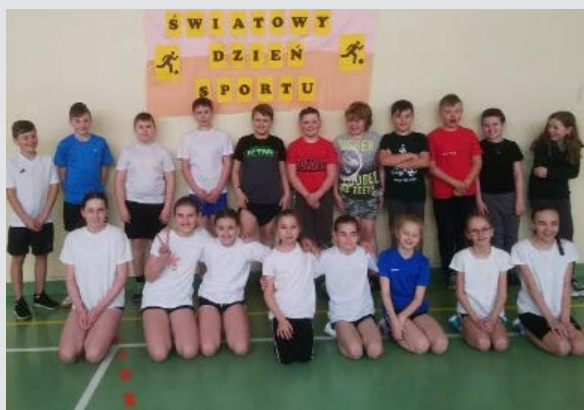
Uczniowie szkoły w Światowym Dniu Sportu