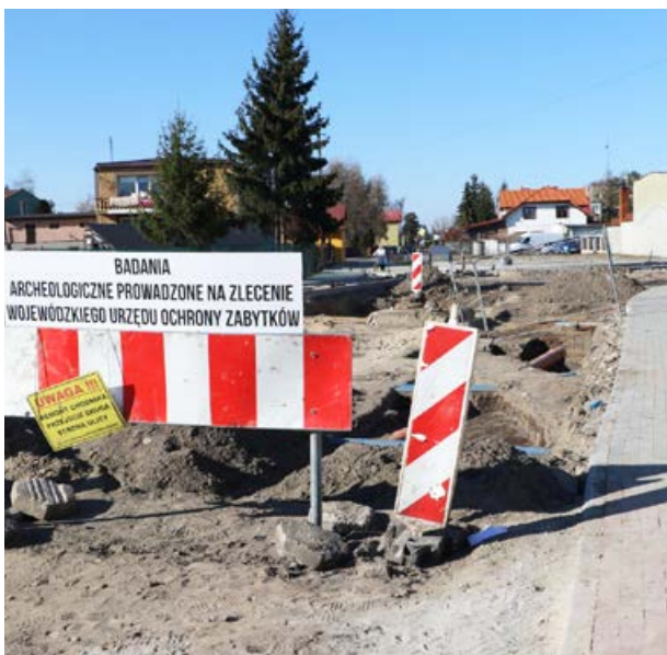
arch. UM Uniejów