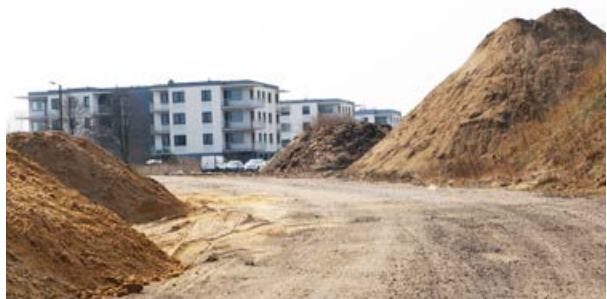
arch. UM Uniejów

Zadanie jest współfinansowane ze środków Rządowego Funduszu Rozwoju Dróg oraz własnych Gminy Uniejów. Otrzymana dotacja opiewa na kwotę 700 tys. zł.