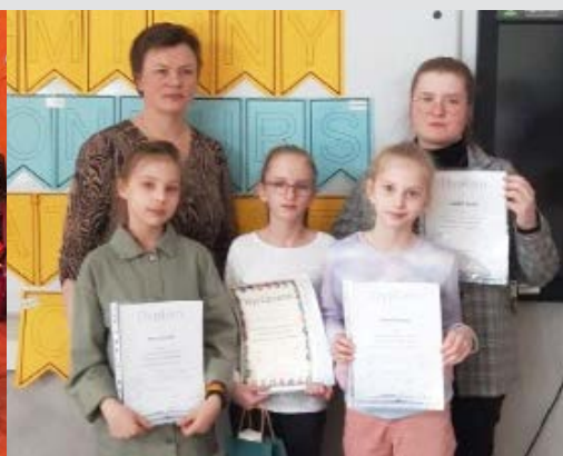
Zwycięzcy „Potyczek Matematycznych”