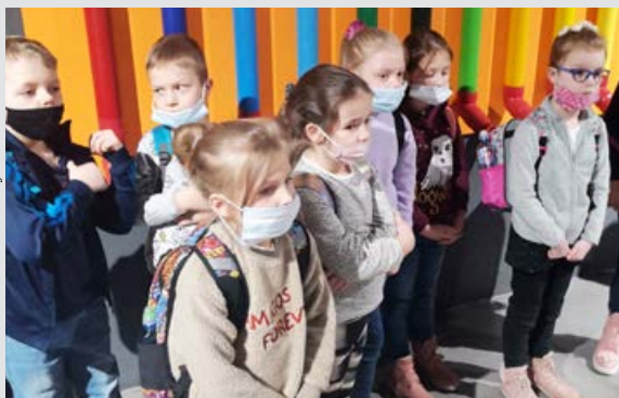
Szkoła Podstawowa w Uniejowie