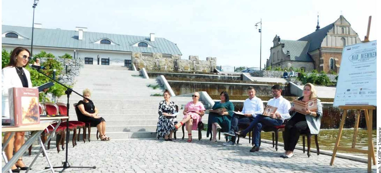
arch. M-GBP w Uniejowie