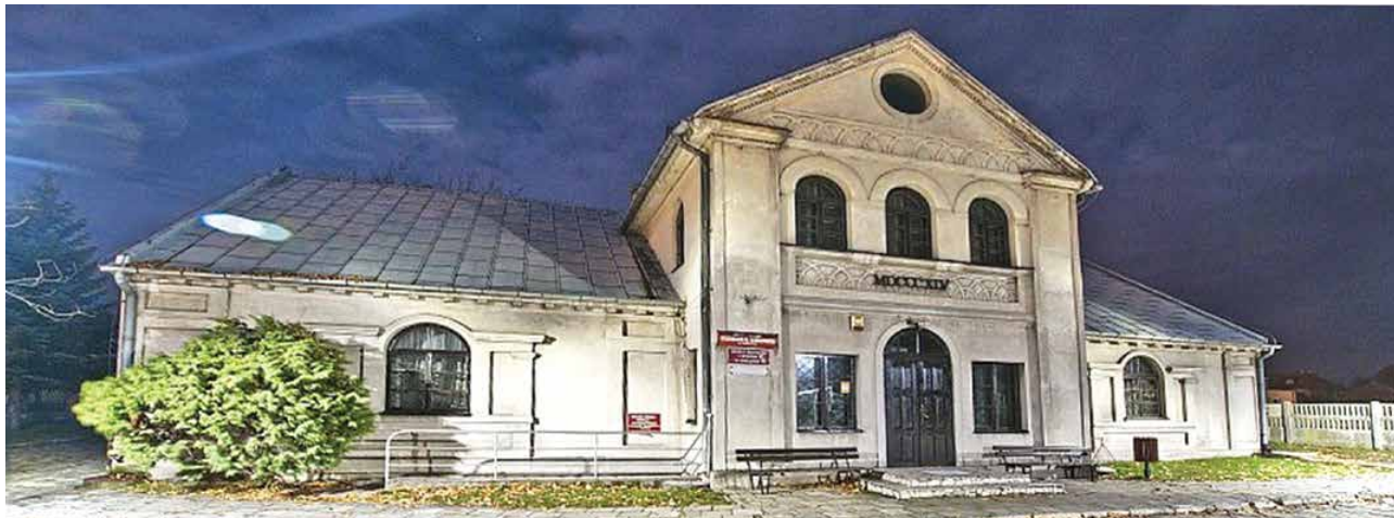
arch. M-GOK w Uniejowie