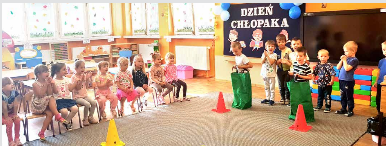
Obchody Dnia Chłopaka

4 października – w dzień wspomnienia św. Franciszka z Asyżu – patrona zwierząt, ekologów i ekologii – odbyła się już VI edycja akcji #SprzątamyDlaPolski. Podobnie jak w latach ubiegłych i tym razem wydarzenie zostało objęte honorowym patronatem Prezesa Rady Ministrów, Mateusza Morawieckiego. Głównym celem przedsięwzięcia była walka z zanieczyszczeniami w lasach, parkach, skwerach i innych terenach zielonych. Polegała ona na masowej akcji sprzątnięcia świata, którą poprzedził kilkutygodniowy cykl edukacyjny. Dzięki