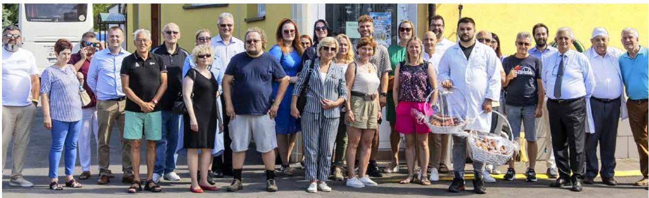
Delegacje przed Zakładem Rzeźniczo-Wędliniarskim „Katusza” w Białej Górze