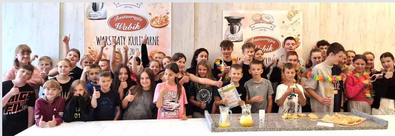
Uczestnicy kulinarnych warsztatów w Zieleniu