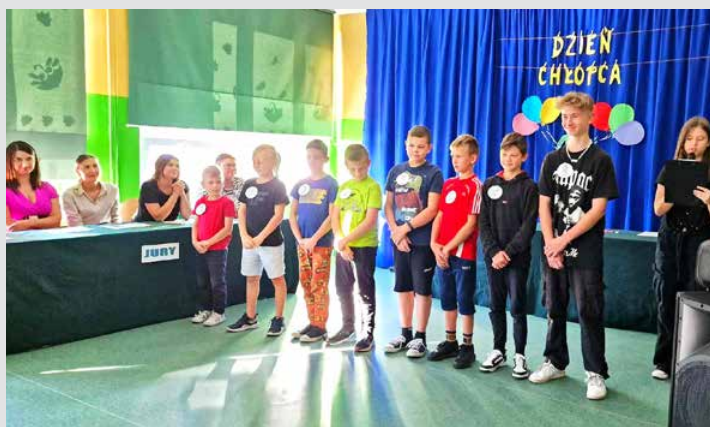
Kandydaci z kl. I-VIII w walce o tytuł „Super chłopak”