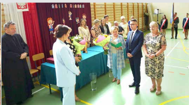
Rozpoczęcie roku szkolnego