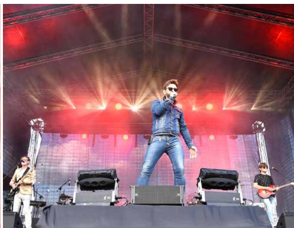
Na scenie Papa D