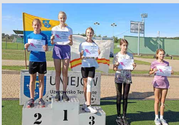
Zwycięzynie biegów przełajowych w Uniejowie