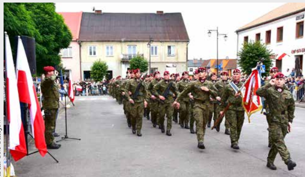
arch. UM Uniejów

powiedzieć, że Polska dzisiaj jest bezpieczna (...)