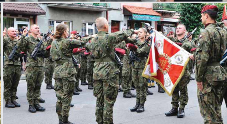
Żołnierze 1 Batalionu Kawalerii Powietrznej złożyli w Uniejowie uroczyste ślubowanie