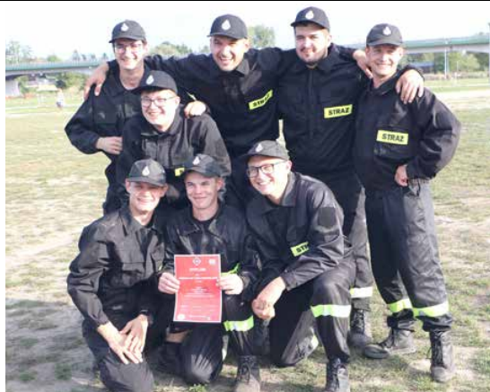
Męska drużyna OSP w Woli Przedmiejskiej