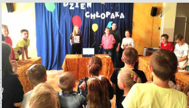
Dzień Chłopaka