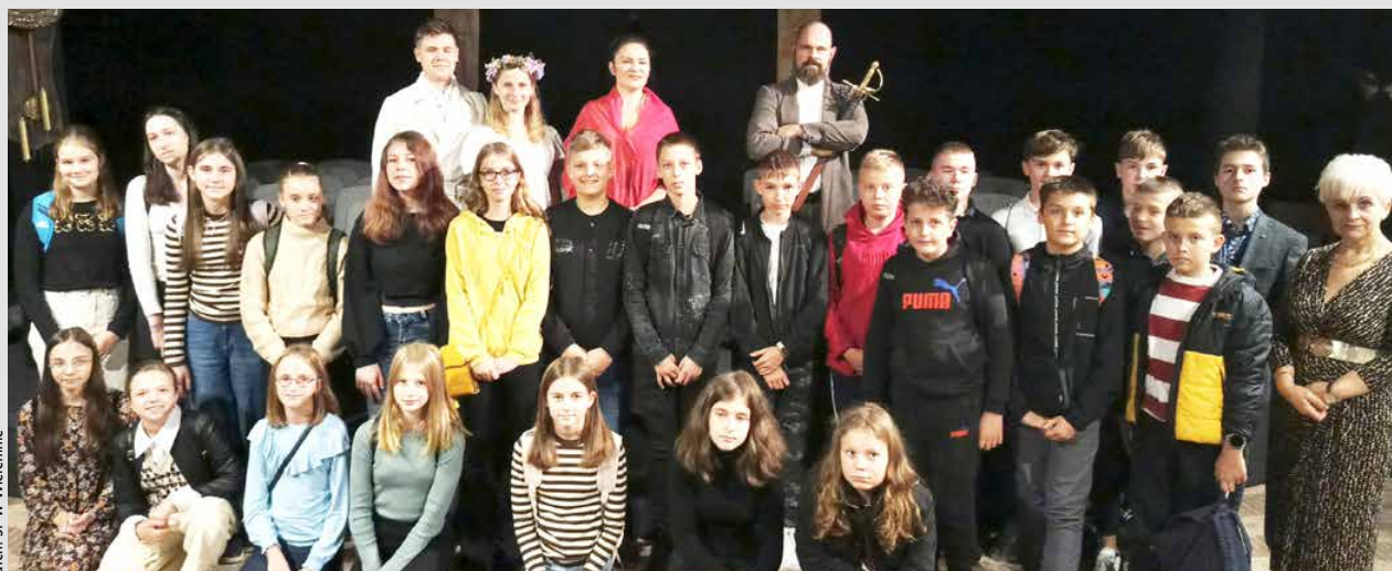
arch. SP w Wielkopolce

Mamy nadzieję, że wizyta w teatrze pomoże zrozumieć fabułę utworu naszym uczniom, a wspólna fotografia z aktorami będzie wspaniałą pamiątką.