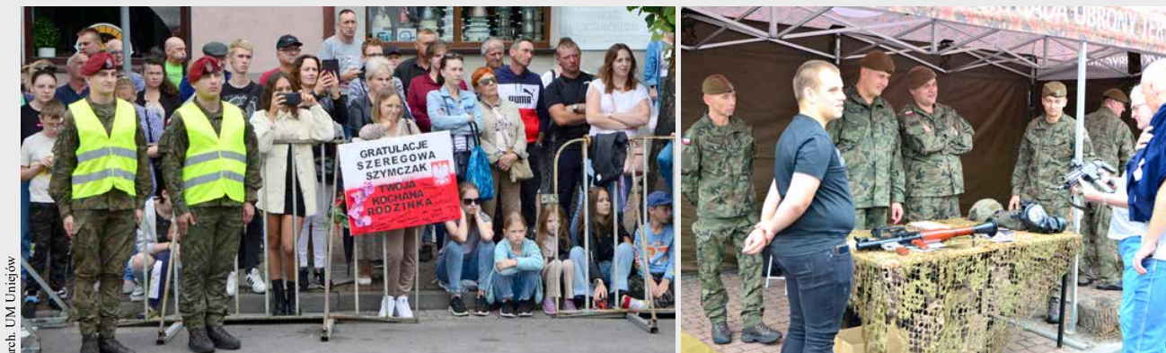
arch. UM Uniejów