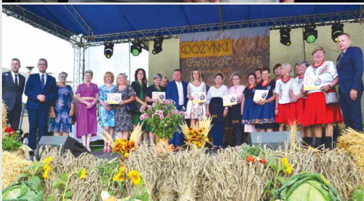
Dożynki Gminno-Parafialne w Wieleninie-Kolonii