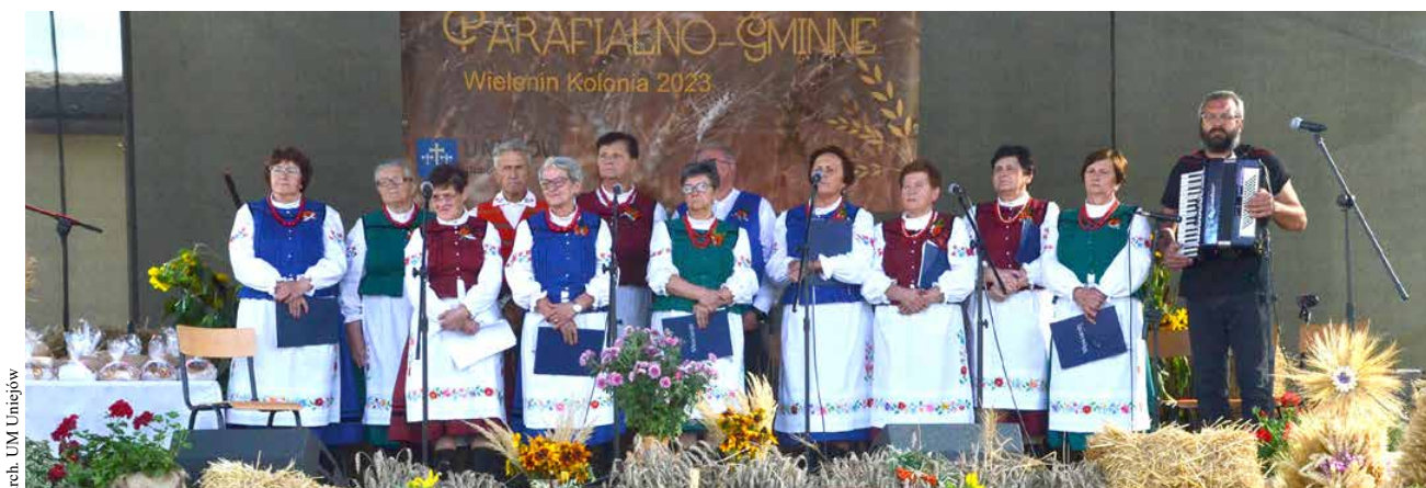
arch. UM Uniejów