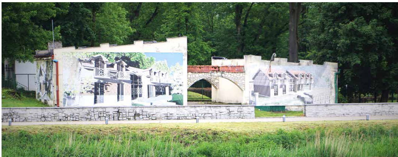
Budynek przed wyburzeniem

Nowy budynek będzie dysponował czterema strefami o zróżnicowanym przeznaczeniu, rozmieszczonymi na dwóch kondygnacjach. Na parterze zaprojektowano część ogólną z recepcją i informacją turystyczną, szatnię