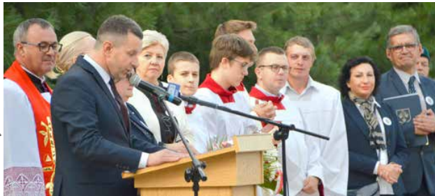
arch. UM Uniejów