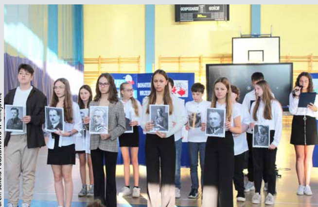
Imieniny Patrona Szkoły