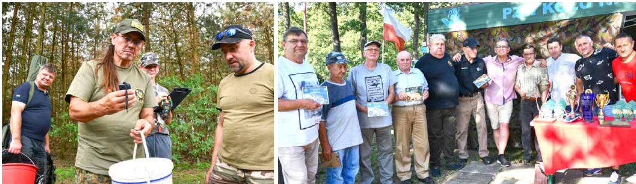
Wędkarze seniorzy z władzami koła wędkarskiego i przedstawicielami władz miasta