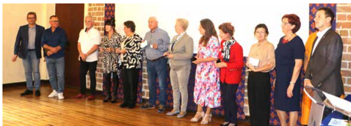
Nowi Słuchacze UTW